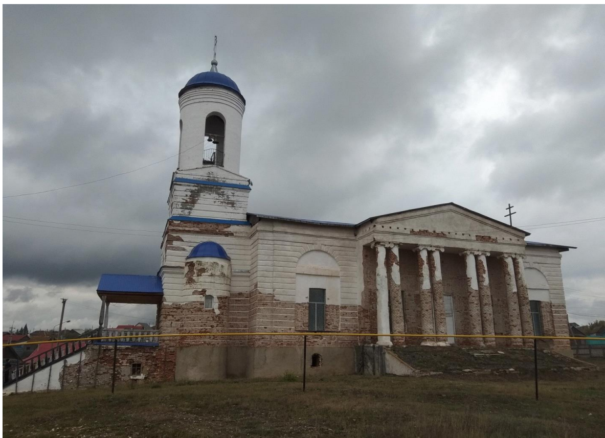
Фото 1. Южный фасад. Церковь, расположенная в центре села Зилаир на горе. Здание, являющееся высотной доминантой застройки села Зилаир Зилаирского района Республики Башкортостан, являющееся частью исторической застройки села Зилаир конца XIX - начала XX веков. Визуальное восприятие памятника с видовых точек села Зилаир Зилаирского района Республики Башкортостан. Сохранившаяся историческая штукатурка. Дата фотографии 27.09.2018 года.