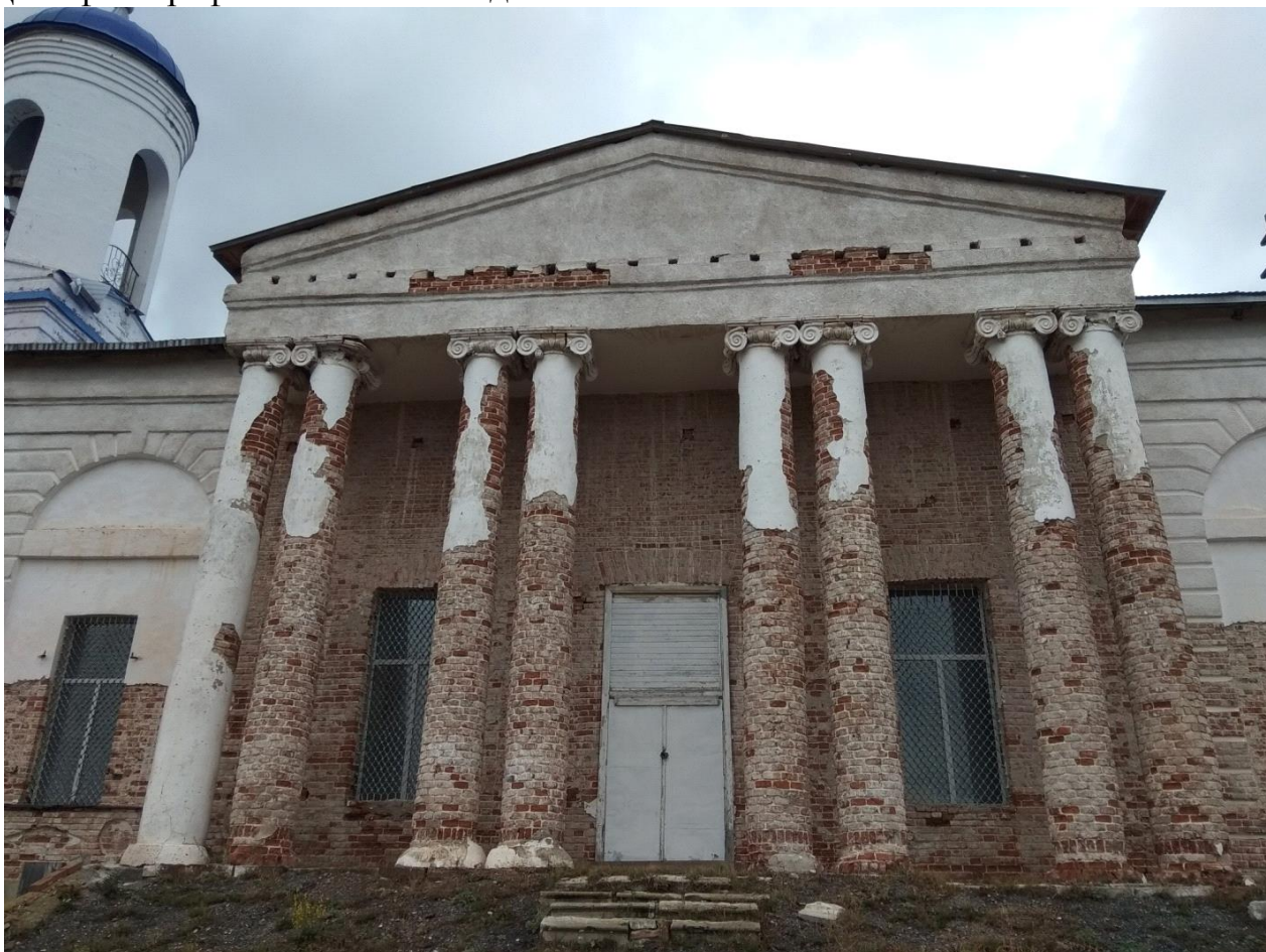
Фото 9. Фрагмент южного фасада. Сохранившаяся историческая штукатурка. Квадратная трапезная; крыльцо южного фасада церкви; восьмиколонный портик южного фасада церкви; ионические колонны с неполным антаблементом и треугольным фронтоном восьмиколонного портика южного фасада церкви; месторасположение, форма и габариты прямоугольных оконных проемов южного фасада церкви; узорные ниши из геометрических фигур. Дата фотографии 27.09.2018 года.

Фото 8. Фрагмент южного фасада. Сохранившаяся историческая штукатурка, крыльцо южного фасада церкви; восьмиколонный портик южного фасада церкви; ионические колонны с неполным антаблементом и треугольным фронтоном восьмиколонного портика южного фасада церкви. Дата фотографии 27.09.2018 года.