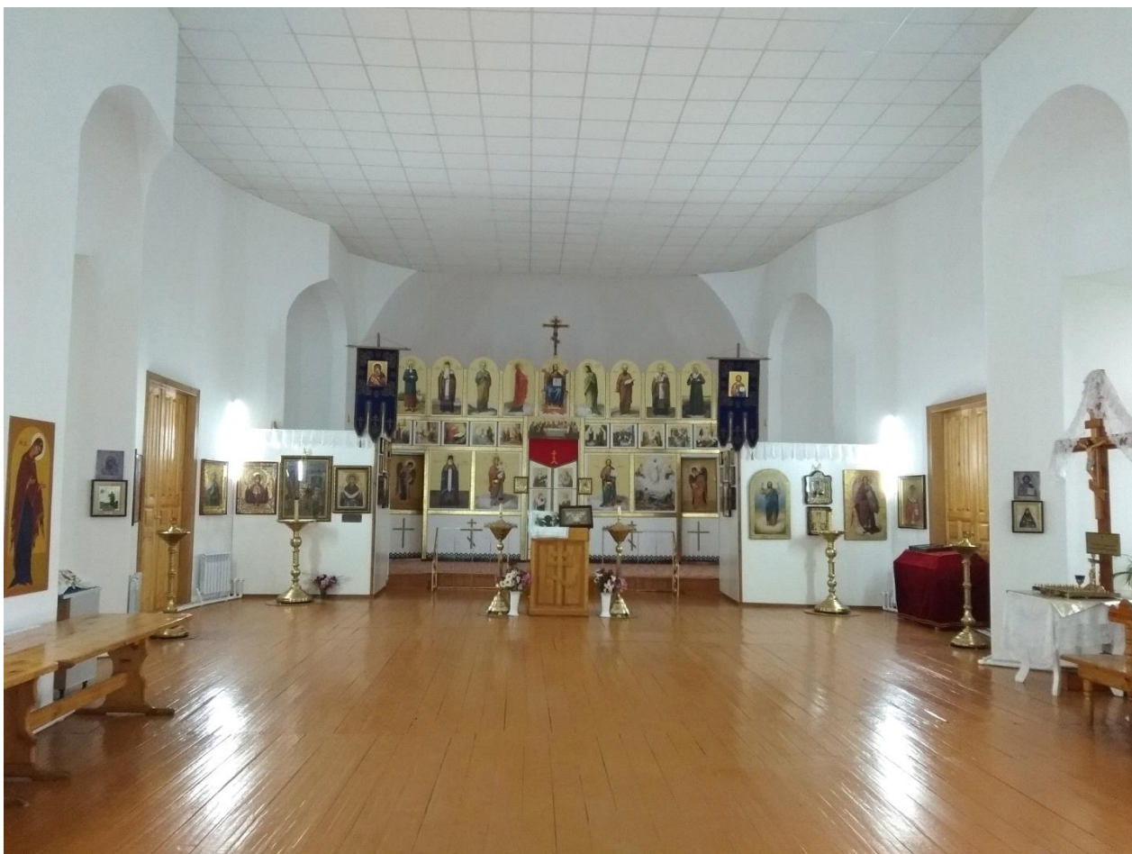
Фото 11. Интерьер. Сохранившиеся фрагменты исторической планировки церкви; скругленная внутренняя поверхность стен. Дата фотографии 27.09.2018 года.