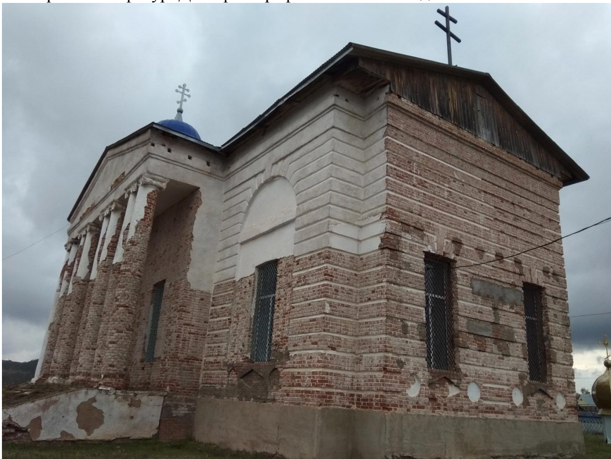
Фото 6. Фрагмент южного фасада и восточный фасад. Сохранившаяся историческая штукатурка. Симметричная относительно продольной оси композиция, складывающаяся из простых геометрических объемов; крыльцо южного фасада церкви; восьмиколонный портик южного фасада церкви; ионические колонны с неполным антаблементом и треугольным фронтоном восьмиколонного портика южного фасада церкви; месторасположение, форма и габариты прямоугольных оконных проемов южного и восточного фасадов церкви; узорные ниши из геометрических фигур. Дата фотографии 27.09.2018 года.

Фото 5. Восточный фасад. Месторасположение, форма и габариты прямоугольных оконных проемов восточного фасада церкви; узорные ниши из геометрических фигур. Дата фотографии 27.09.2018 года.