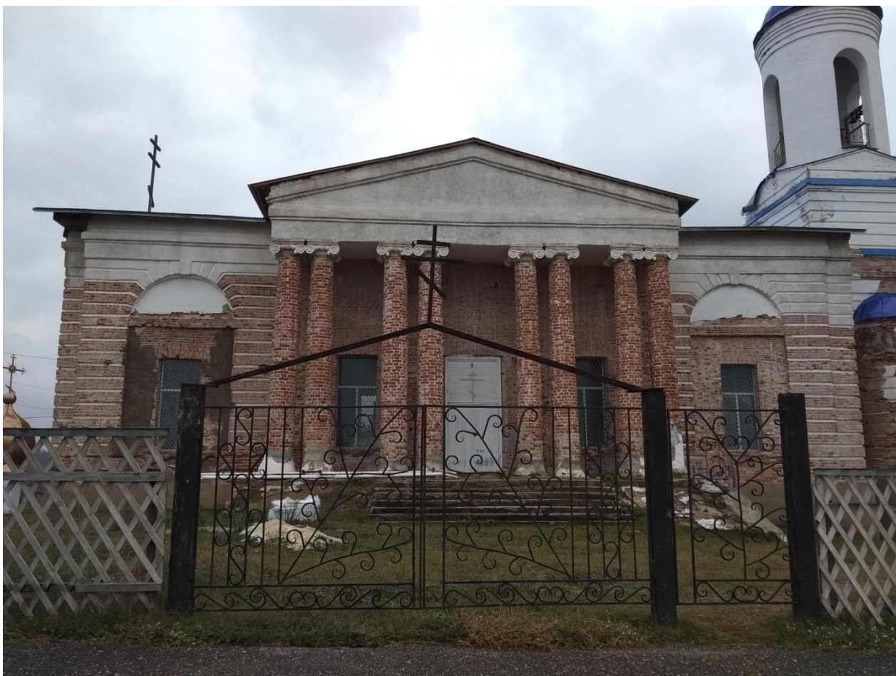
Фото 3. Фрагмент северного фасада. Форма крыши сложной конфигурации. Сохранившаяся историческая штукатурка. Симметричная относительно продольной оси композиция, складывающаяся из простых геометрических объемов; квадратная трапезная; два полукруглых объема; крыльцо северного фасада церкви; восьмиколонный портик северного фасада церкви; ионические колонны с неполным антаблементом и треугольным фронтоном восьмиколонного портика северного фасада церкви; месторасположение, форма и габариты прямоугольных оконных проемов северного фасада церкви. Дата фотографии 27.09.2018 года.