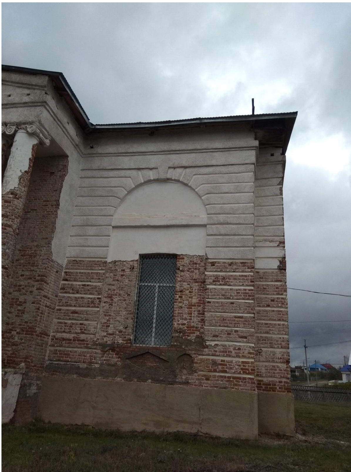
Фото 7. Фрагмент южного фасада. Сохранившаяся историческая штукатурка. Ионическая колонна с неполным антаблементом восьмиколонного портика