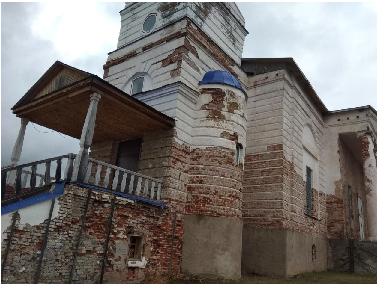
Фото 10. Фрагмент западного и фрагмент южного фасадов. Церковное здание, в плане «ковчегобразное» с округленной ротондальной колокольней. Симметричная относительно продольной оси композиция, складывающаяся из простых геометрических объемов; квадратные апсида и трапезная; полукруглый объем; восьмиколонный портик южного фасада церкви; ионическая колонна с неполным антаблементом восьмиколонного портика южного фасада церкви; месторасположение, форма и габариты прямоугольных оконных проемов южного фасада церкви; месторасположение, форма и габариты лучковых оконных проемов южного фасада церкви; узорные ниши из геометрических фигур. Дата фотографии 27.09.2018 года.