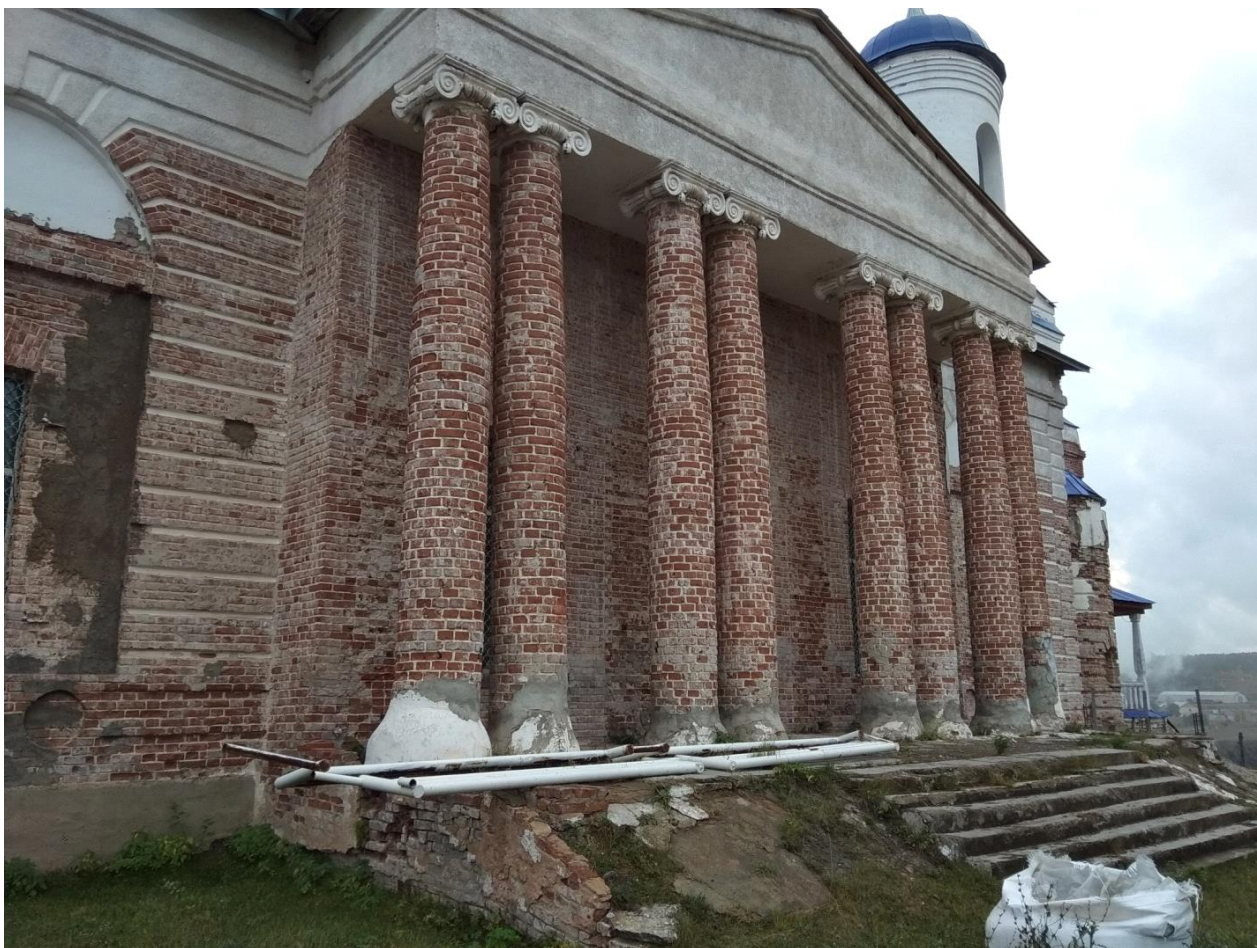
Фото 4. Фрагмент северного фасада. Крыльцо северного фасада церкви; восьмиколонный портик северного фасада церкви; ионические колонны с неполным антаблементом и треугольным фронтоном восьмиколонного портика северного фасада церкви; месторасположение, форма и габариты прямоугольных оконных проемов северного фасада церкви; узорные ниши из геометрических фигур. Дата фотографии 27.09.2018 года.